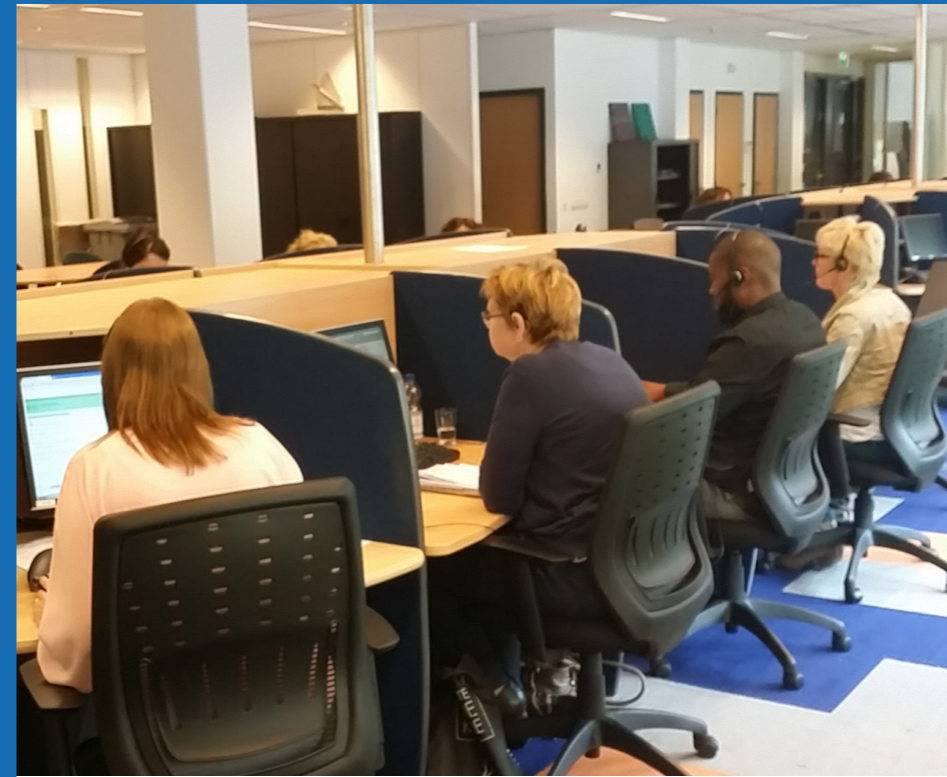
Het callcenter van Conclusr Datacollection Services